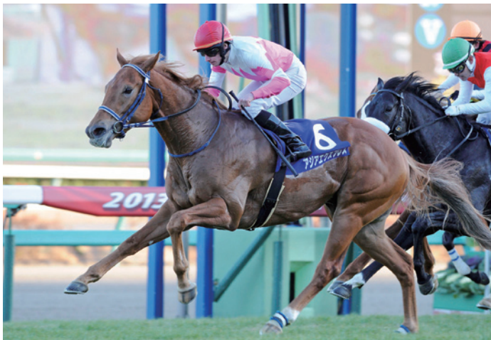
朝日杯フューチュリティS-G1 (2013.12.15)