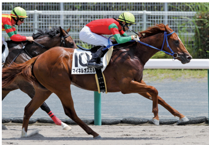
マイネルオスカル 2歳新馬(2017.7.8)