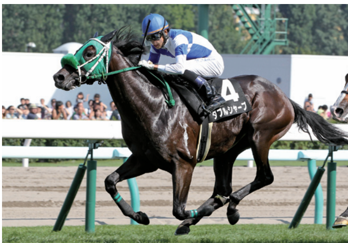
ダブルシャープ クローバー賞-OP(2017.8.20)