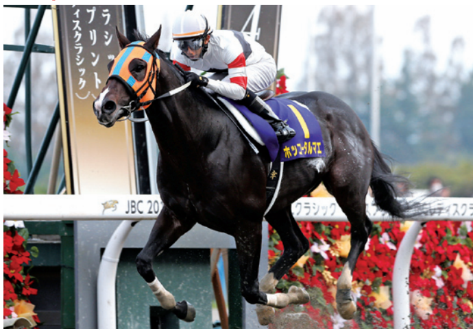
JBCクラシック-Jpn1 (2013.11.4)