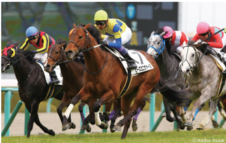
ピースユニヴァース 3歳500万下 2018.3.3 阪神・芝1400m・良

曾祖母ソニックレディ Sonic Ladyは全欧3歳牝馬チャンピオン、英愛仏8勝、愛1000ギニー-G1、ムーランドロンシャン賞-G1、サセックスS-G1